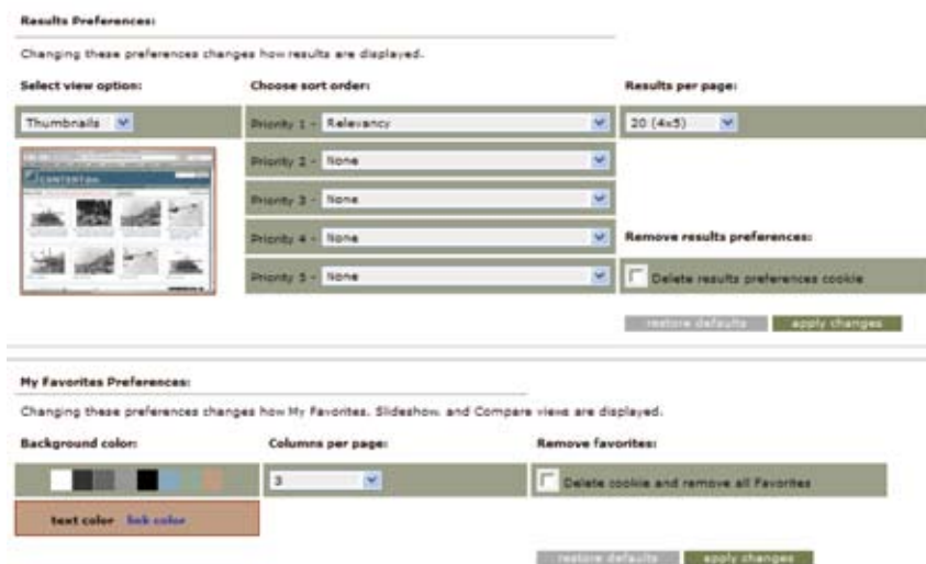
图6 USFWS国家数字图书馆的个性定制参数设置