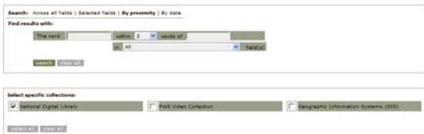
图3 USFWS国家数字图书馆的邻近检索