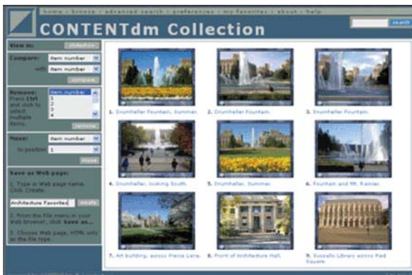
图5 USFWS国家数字图书馆的“我的收藏”网页

功能。除了收藏、比较、打印，该数字图书馆还提供了将收藏夹内容保存为网页的服务。如图5为用户按个人喜好自主生成的“我的收藏”网页页面。