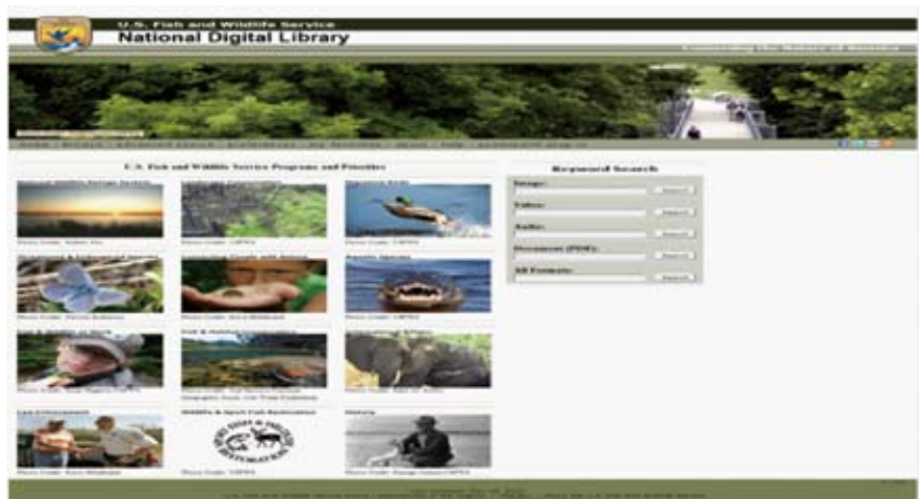
图1 USFWS国家数字图书馆主页

源以图片为主，有少量的音视频和地图资源，其格式多数是压缩的RGB、JPEG或PDF文件。其条目主要提供图片查看器、PDF阅读器和音视频播放器3种方式查看，内容均可下载。